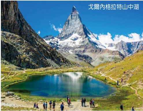
戈爾內格拉特山中湖