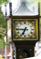
煤氣鎮 - 蒸氣鐘

Morning commence Vancouver city tour to Chinatown, Gastown and Stanley Park. Early afternoon proceed to Canada Place, Flyover Canada (admission not included), Seawall water walk, Winter Olympic Park, Capilano Suspension Bridge (admission not included), Queen Elizabeth Park.