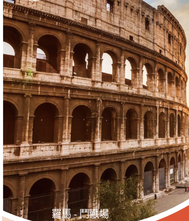
羅馬 - 鬥獸場