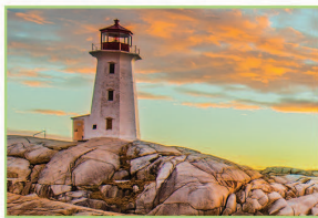
佩姬灣漁村 Peggy's Cove

北美八大奇景之一，乘坐豪華遊輪，觀賞位於美加邊境的聖勞倫斯河上星羅棋佈的私人島嶼避暑勝地。