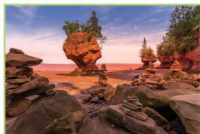
好望角石林奇景 Hopewell Rocks

世界第二大不凍港—乘坐仿古遊輪暢遊海港，遍覽“雙子城”美景、大西洋艦隊海軍基地、喬治島、古老的燈塔和碼頭……。