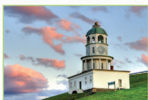
哈利法斯海港 Halifax Harbor

世界第二大不凍港—乘坐仿古遊輪暢遊海港，遍覽“雙子城”美景、大西洋艦隊海軍基地、喬治島、古老的燈塔和碼頭……。