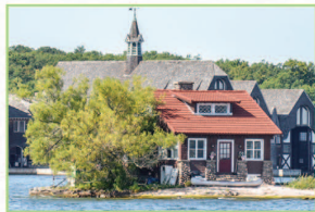
千島 Thousand Island

舉世聞名的自然奇景—聖約翰河狹窄的河口，與浩瀚大西洋的碰撞，人生難得一見的神奇自然景觀。