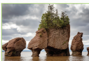
磁力山 Magnetic Hill