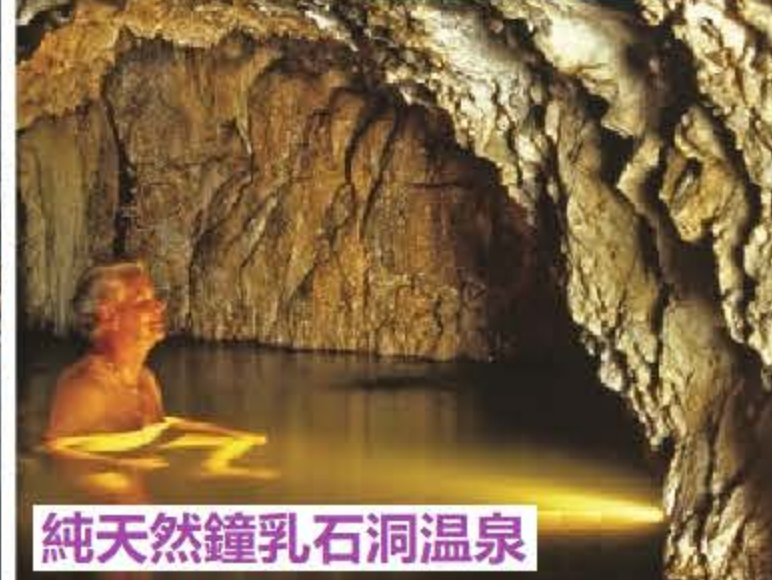
純天然鐘乳石洞溫泉