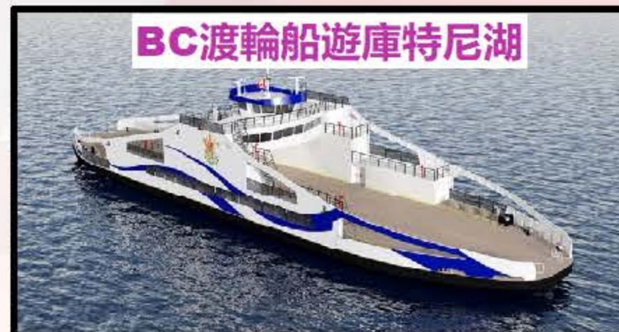
BC渡輪船遊庫特尼湖