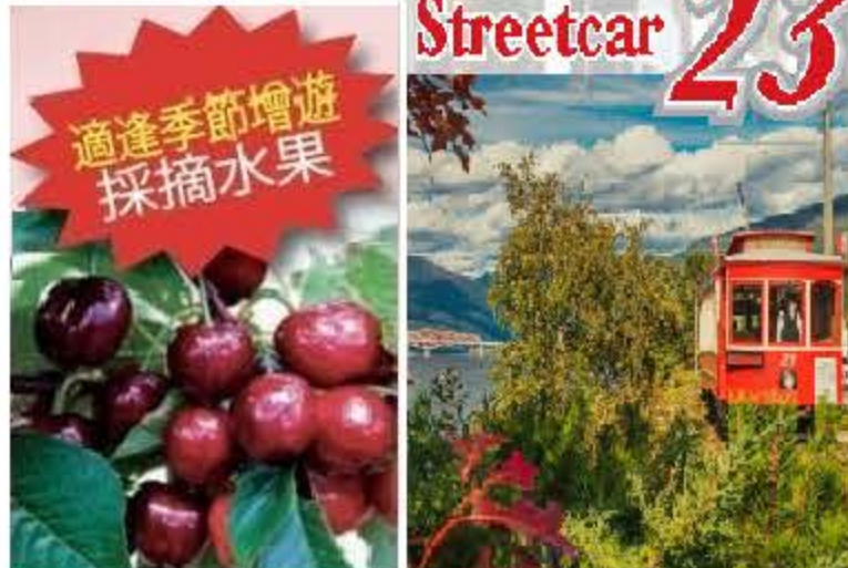
適逢季節增遊採摘水果

早上前往加西最暖之克里斯蒂娜湖,之後到葡萄園品嚐紅、白酒或到果園購買水果,適逢季節更可採摘新鮮水果如:櫻桃、水蜜桃等。回程稍停蜂蜜農場,田園氣息洋溢全身,更將這感覺帶回溫暖之家溫哥華。