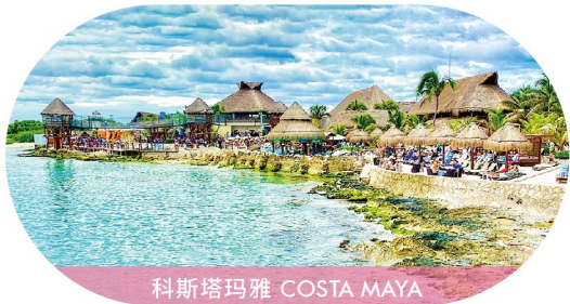
科斯塔玛雅 COSTA MAYA