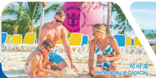
可可湾 Perfect Day at CocoCay

DAY 4 返回奥兰多 Port Canaveral, United States