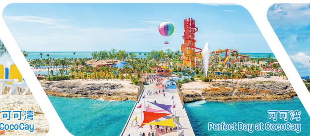
可可湾 Perfect Day at CocoCay